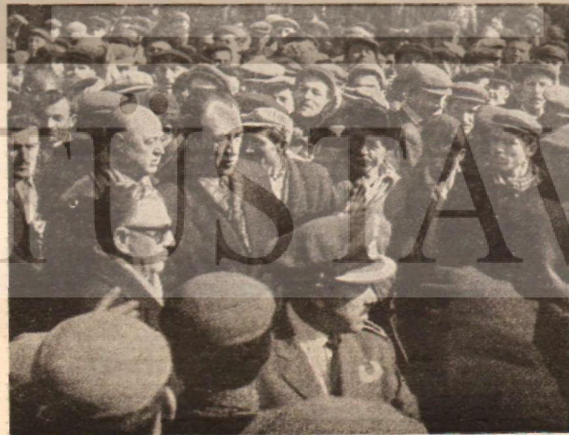
İşçileri Bakanı ve diğer görevliler olay yerinde.